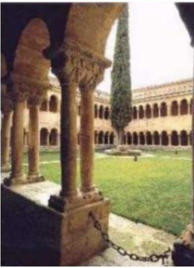
El ciprés de Silos

Catedrático de Lengua y Literatura en diversos institutos. Premio Cervantes en 1979.